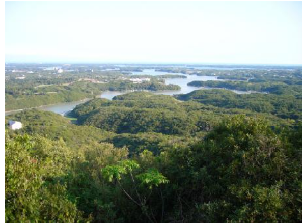
(付近の高台から英虞湾を望む)

ところが、この英虞湾の汚濁が深刻になっていたのです。英虞湾の真珠養殖は1960年代半ばまでに急速に拡大しましたが、他方で従来さかんだった沿岸漁業はこの時期激減しました。1980年代後半からはリゾート開発もさかんに行われました。閉鎖性海域である英虞湾はもともと海水が汚れやすかったのですが、高度成長期の生活様式の変化を伴う生活排水の増加や、内湾漁獲量の減少、干潟やアマモ場の消失、真珠養殖の拡大に伴うアコヤガイのフンや死骸など有機物の海底への堆積などが要因となり、赤潮や貧酸素水塊が毎年のように発生して、真珠養殖などに大きな被害が出るようになりました。